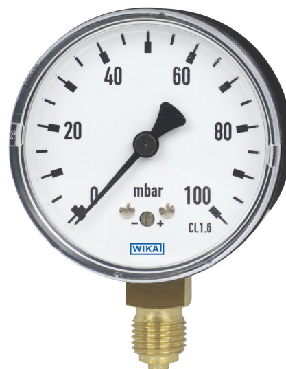
Manometr puszkowy model 611.10